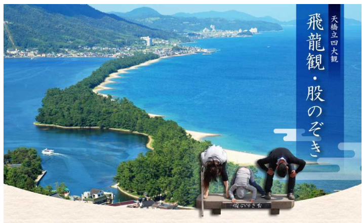
天橋立、南と北;2つの場所からの展望