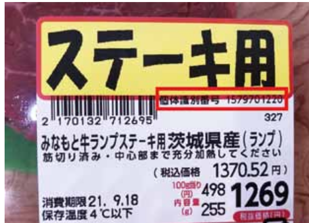
【写真3 スーパーで売られる牛肉のラベル】