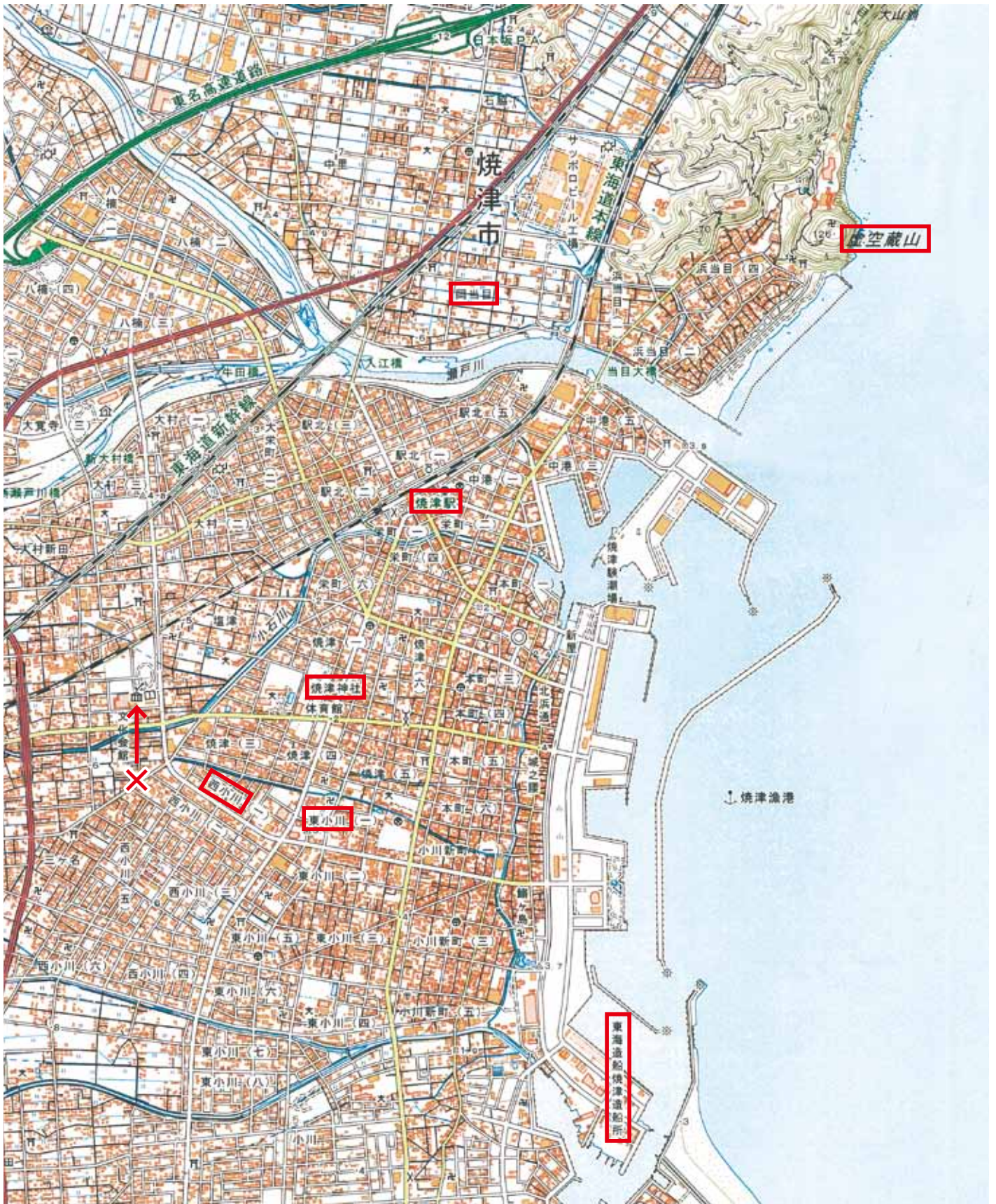
【地図 国土地理院2万5千分の1地形図 焼津を拡大したもの】