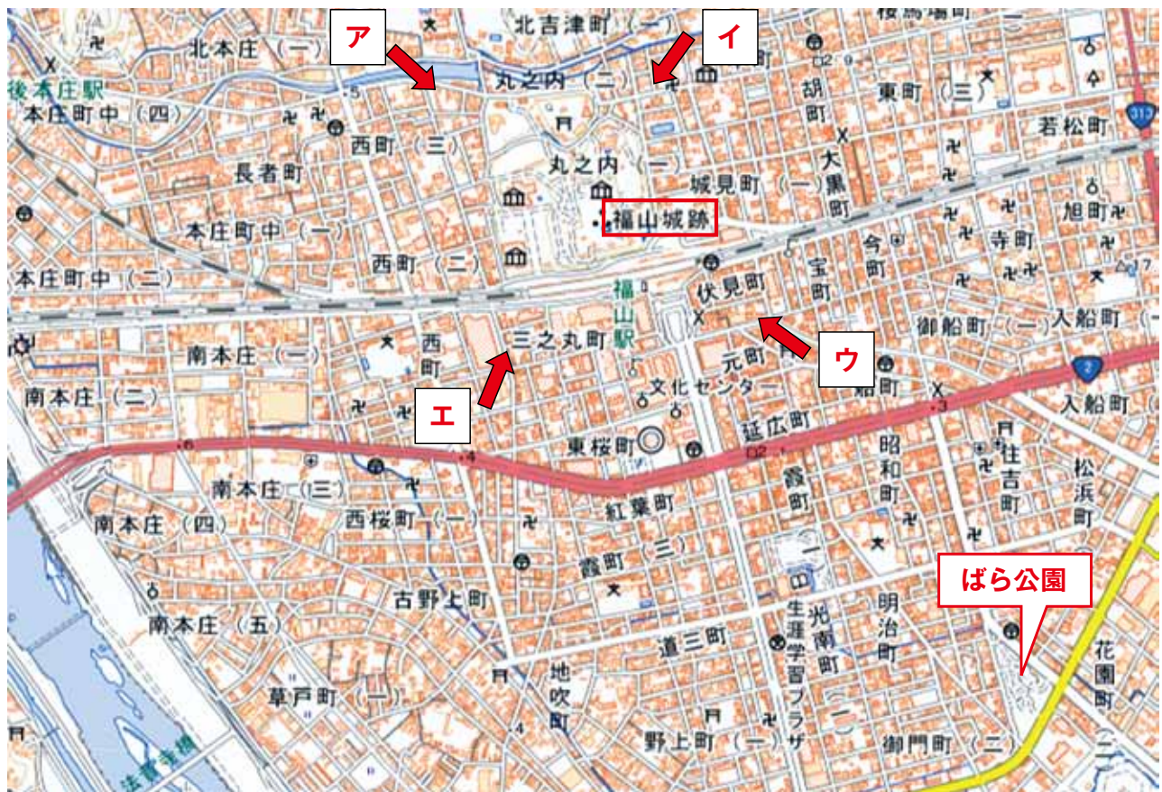
【広島県福山市（地理院地図より 25000 分の 1 地形図を拡大したもの）】