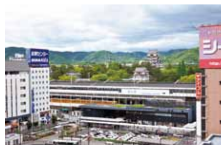
【写真1 福山駅と福山城】

さて、地図を見てみましょう。駅前に福山城があり新幹線から見えるお城としても知られています。福山城の位置は敵からの攻撃を受けやすい場所であったため、砲弾などの攻撃に耐えられるよう天守の壁面には鉄板が張られていました。地図を見ると福山城跡（福山城公園）には三つの（う）があることがわかります。きっと、福山城を見学する前に立ち寄ると役に立つことでしょう。福山市の名所には福山城のほかに「ばら公園」があります。ばら公園は「戦災で荒廃した街に潤いを与え、人々の心に和らぎを取り戻そう」と住民がばらの苗木を1000本植えたことから始まったそうです。25000分の1の地形図を見ると、ばら公園の位置は福山城から（え）の方位に③ 直線距離 で5cmの距離にあるので、ゆっくり歩いても30分ぐらいで到着できそうです。