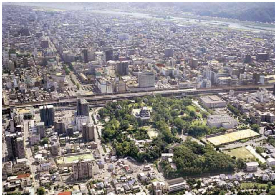
【写真3 上空から見た福山市】