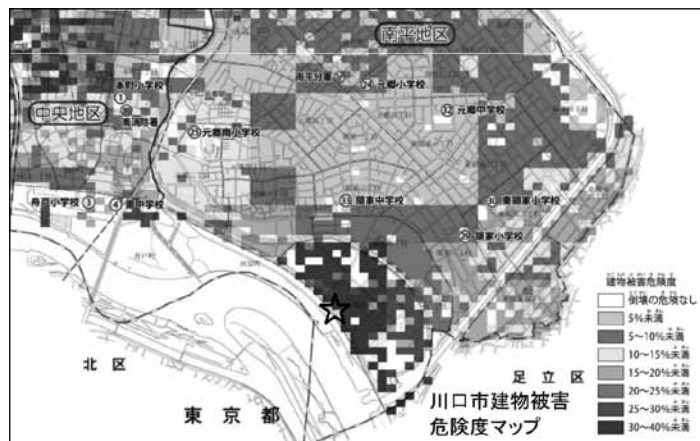
川口市ハザードマップ

2011年に発生した東北地方太平洋沖地震（3.11 東日本大震災）以降、各自治体では、それぞれの地域の特性にもとづいて自然災害を想定したハザードマップ（災害予想地図、防災マップともいう）がつくられています。多くの学校が地域の避難場所に指定されることも多いと思われます。また、本校が避難所となった場合、皆さんも「守られる立場」から「助ける立場」で行動することが必要になってきます。その際、避難所であるあなたができることは何ですか。具体的な例を2つあげて説明しなさい。