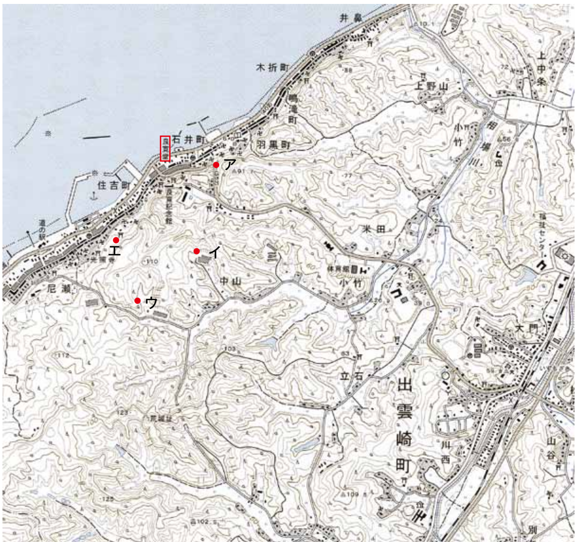
地図 2万5千分の1 地形図「出雲崎」