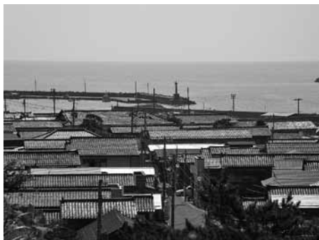
【写真2】妻入りの町並みと港