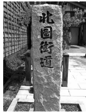
【写真3】北国街道の碑 ひ

「妻入り」とは屋根の側面である三角形の部分に出入り口を設け、それを正面として道路に向かっているものです。ですから、家の中は奥が深く、正面の玄関に対して非常に細長い構造になっています。