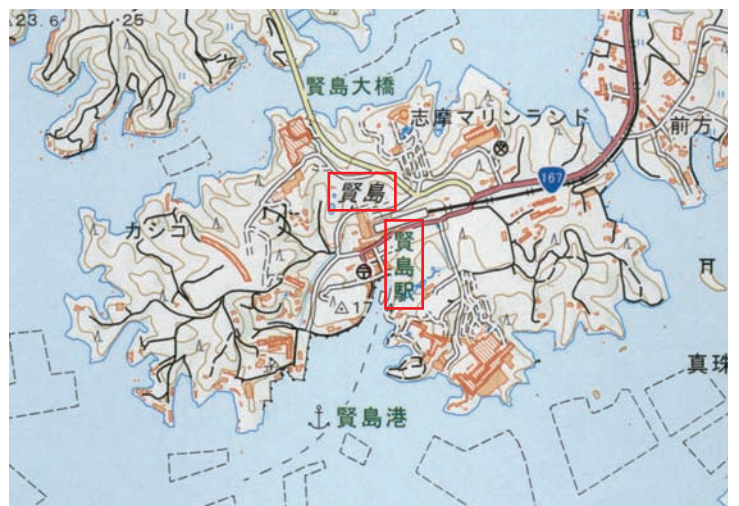
地図 2 賢島拡大図