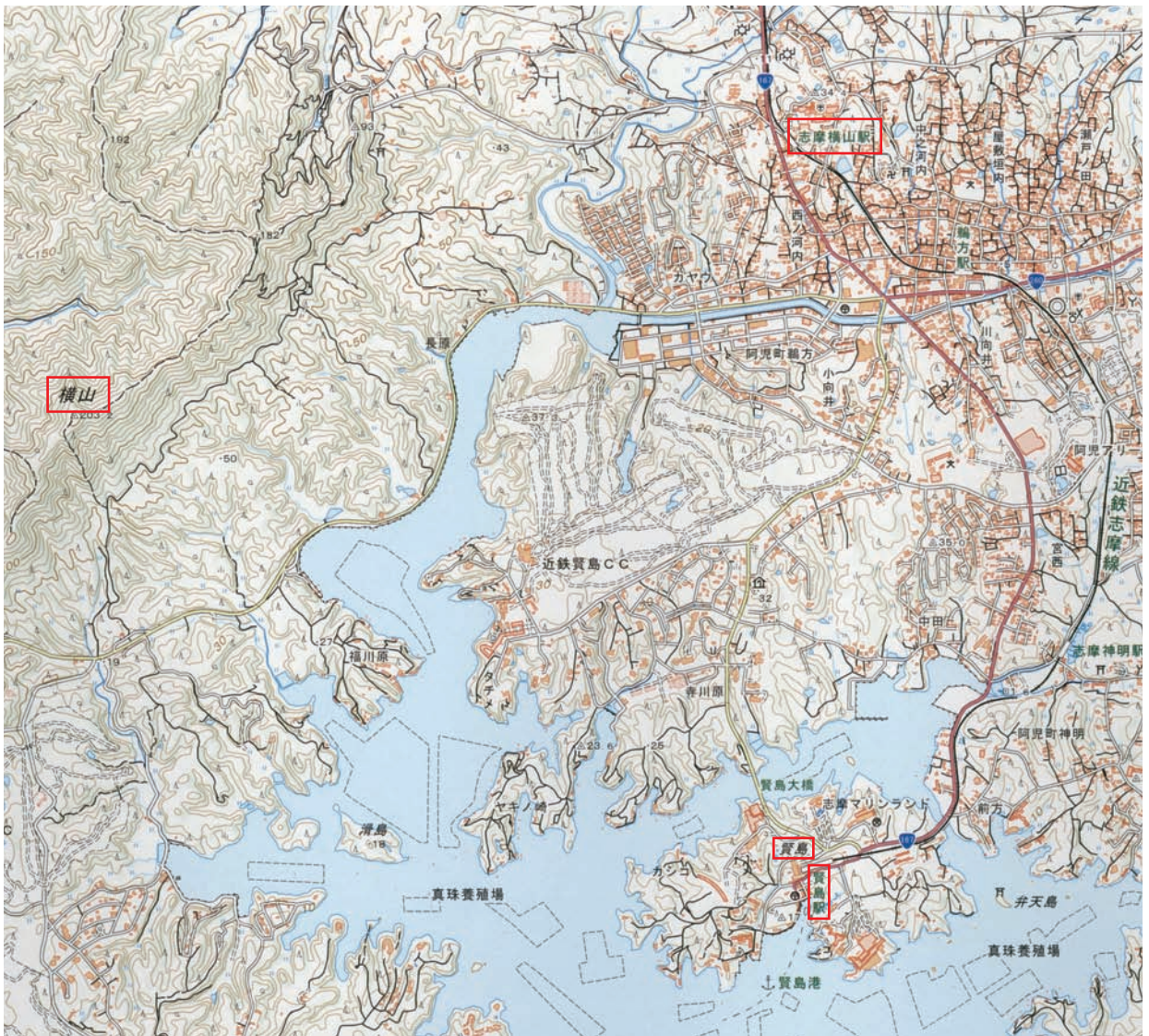
地図 1 2万5千分の1地形図「浜島」