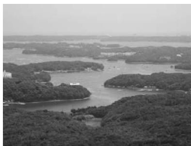
写真1 横山展望台からの英虞湾

魅力的な真珠、美しく豊かな自然、新鮮な魚介類は賢島に多くの人を呼び寄せています。